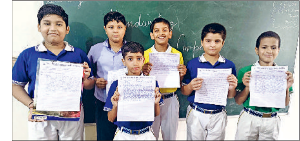
द आर्यन ग्लोबल विद्यालय में अंग्रेजी हस्तलेखन प्रतियोगिता में भाग लेते बच्चे।