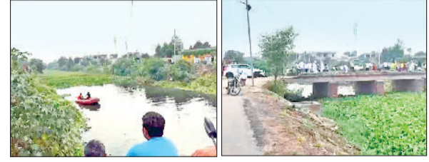
रोहतक। ट्रेन में युवक की तलाश करते एनडीआरएफ टीम व ट्रेन पर मौजूद लोग।

गांव सांधी चिड़ी रोड पर देर रात ट्रेन नंबर आठ में एक कार पलट गई, जिससे कार में सवार चार युवकों को किसी तरह बाहर निकाला गया, लेकिन एक युवक नहीं मिला, जिसकी तलाश में सुबह ग्रामीणों ने ट्रेन में उतरकर उसकी खोजबीन की, लेकिन युवक का कोई पता नहीं चला पाया। बाद में पुलिस भी मौके पर पहुंची और इस बारे में जांच पड़ताल की। देर रात पांच युवक कार में सवार होकर रोहतक की तरफ आ रहे थे,