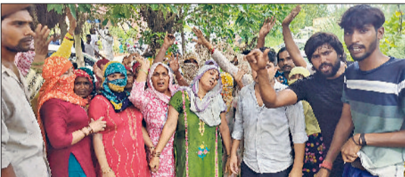
रोहताक। पुलिस थाने में रोष जताने पहुंचे परिजन।